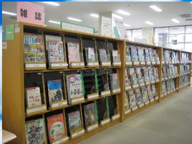
駅南図書館雑誌コーナー